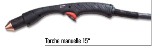
Torche manuelle 15°