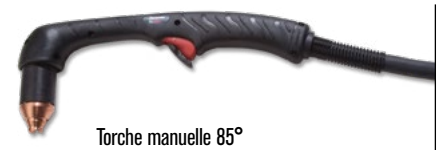
Torche manuelle 85°

(pour plus d'options de torche, consulter www.hypertherm.com )